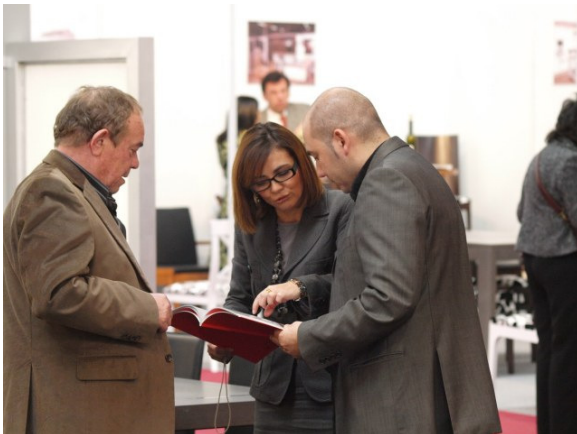
Imagen de la pasada edición de la Feria del Mueble que tuvo lugar en enero de 2008

El objetivo prioritario de la Feria del Mueble de Zaragoza 2010 es el de